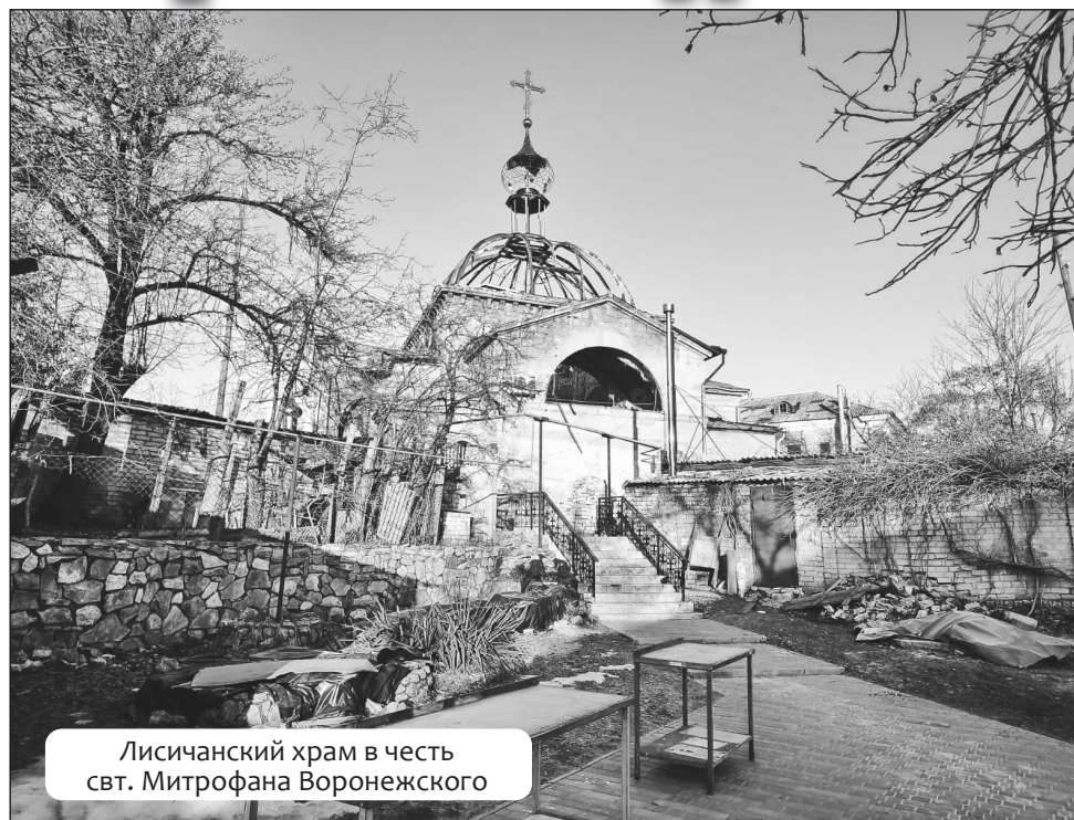
Лисичанский храм в честь свт. Митрофана Воронежского

Наш проводник навел родителей, с которыми не виделся восемь лет. Они его не ожидали, ведь связи там нет. Мама сначала не узнала сына, потом стала переживать, что с ним что-то случится: «Зачем приехал?» Он говорит: «Вареников твоих поесть». Шутка шуткой, а она принесла вареники со словами: «Почему-то сегодня мне захотелось сделать вареники». Нас потчевала, а сама отказывалась и говорила: «У нас все есть». А когда увидела шоколадные конфеты, не вы-