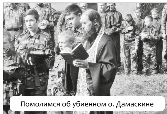
Помолимся об убиенном о. Дамаскине