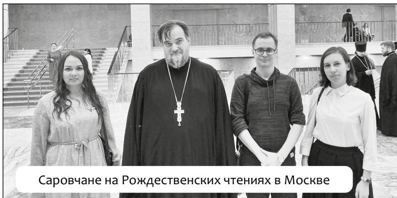
Саровчане на Рождественских чтениях в Москве