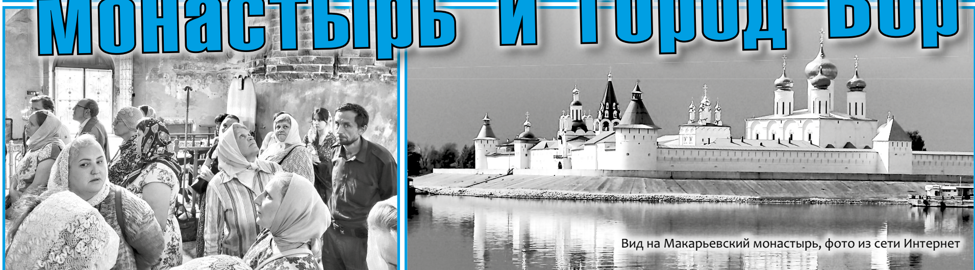
Вид на Макарьевский монастырь