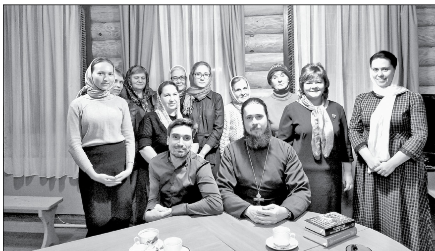
М. Курякина, фото предоставлены Саровской дивизией Росгвардии