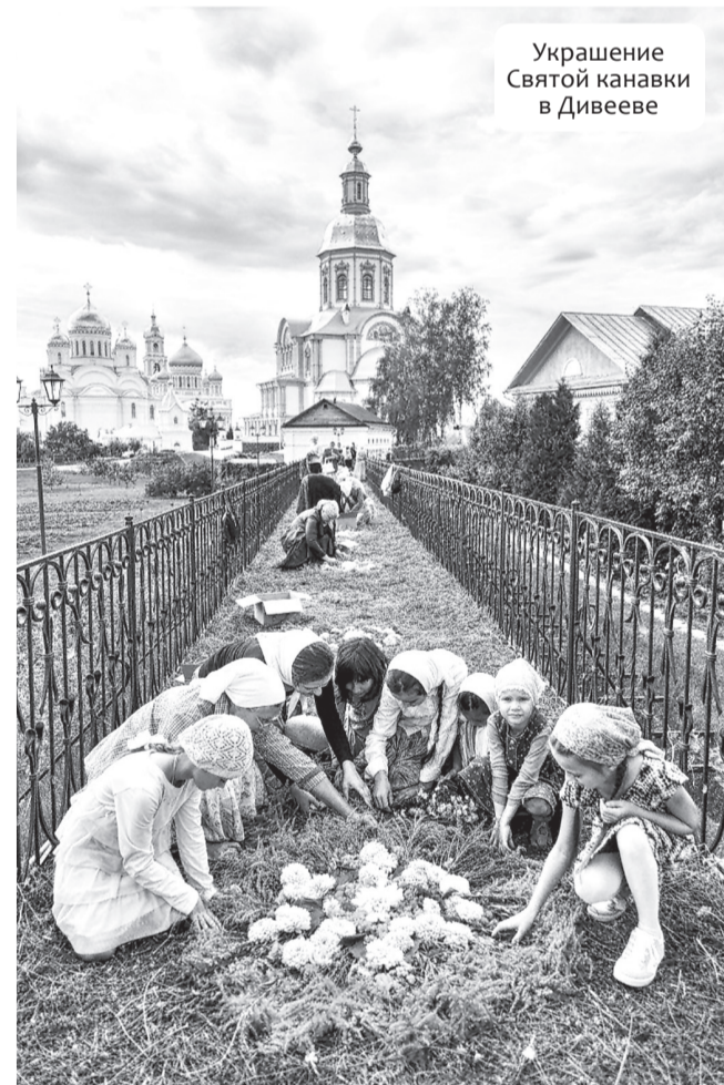
Украшение Святой канавки в Дивееве

30 августа были подведены итоги грантового конкурса «Православная инициатива 2016-2017». В нем приняла участие 695 проектов из 74 регионов России и 10 стран ближнего и дальнего зарубежья. Победителями конкурса малых грантов стали 115 проектов по направлениям «Образование и воспитание», «Социальное служение», «Культура» и «Информационная деятельность». В число победителей конкурса вошел проект Саровской православной гимназии «Дети расписывают трапезную». По условиям Положения о конкурсе размер запрашиваемого гранта не мо-