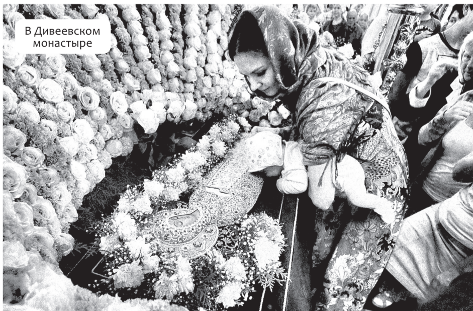
В Дивеевском монастыре

жет превышать 120 тыс. рублей. Грантовая поддержка победителям конкурса будет оказываться на условиях обязательного финансирования расходов на реализацию проекта.