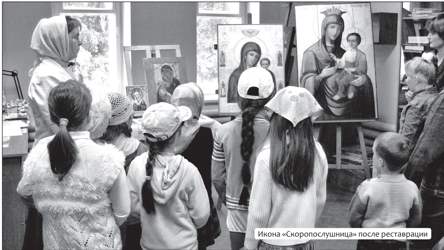
Икона «Скоропослушница» после реставрации

Прихожане храма прп. Серафима Саровского. Продолжение следует