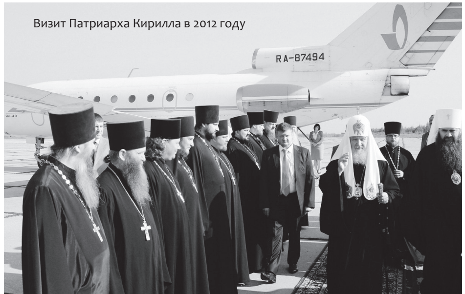
Визит Патриарха Кирилла в 2012 году

Планы нынешнего празднования обсуждались еще в августе 2014 года в резиденции Патриарха Московского и всея Руси, где состоялась рабочая встреча Патриарха Кирилла и Валерия Шанцева. Святейший Патриарх выразил благодарность губернатору «за тот уровень